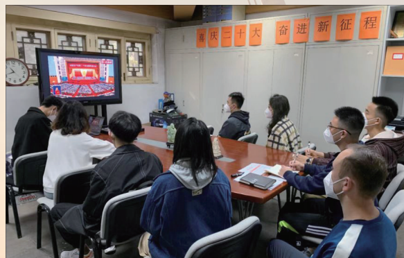
少数民族学生骨干在统战部会议室集中收看。