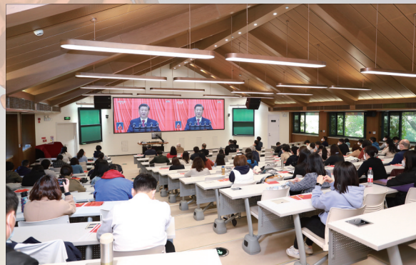
校机关党委组织党员、干部、职工代表在西阶梯教室集中收看。