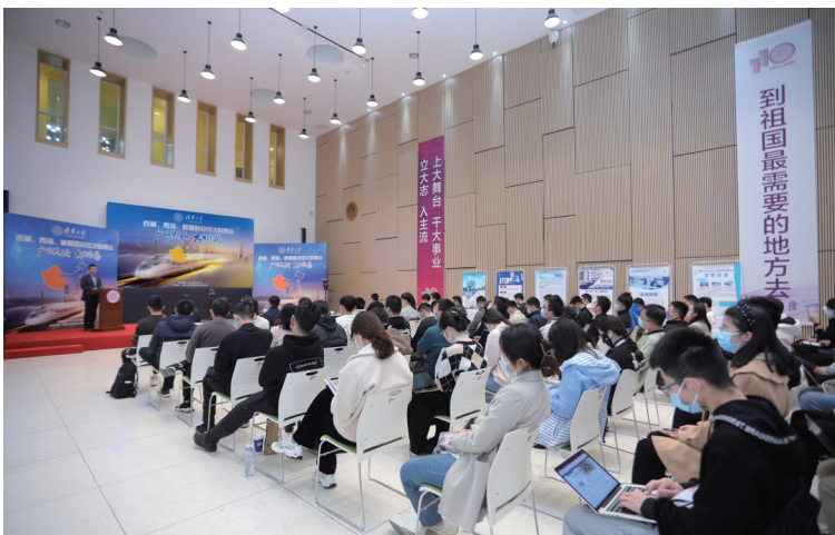
联合引才招聘会现场。

本报讯 10月13日下午,清华大学2022年“西藏、青海、新疆联合引才招聘会”暨“西部人才周”首场招聘会以线上线下相结合的形式举行。校党委副书记过勇,西藏自治区党委组织部副部长尹春辉,青海省委组织部副部长徐小兵、省教育厅副厅长梅岩、省人社厅副厅长史弘展,新疆维吾尔自治区党委组织部副部长、公务员局局长陈志江等出席活动。