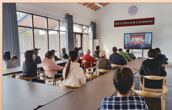
清华大学乡村振兴工作站泗水站内工作人员与村民集中收看。