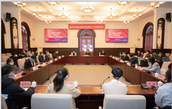
清华大学召开座谈会,师生热议党的二十大报告。