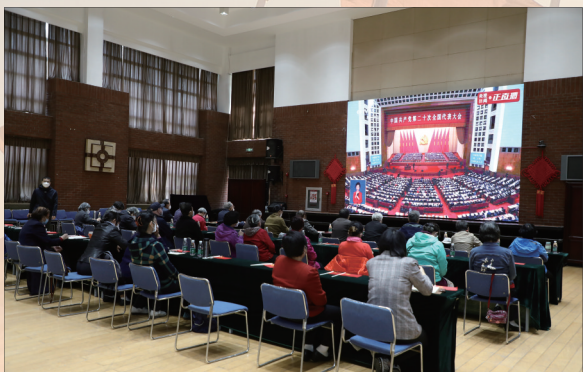
离退休工作部组织老同志代表在老年活动中心集中收看。