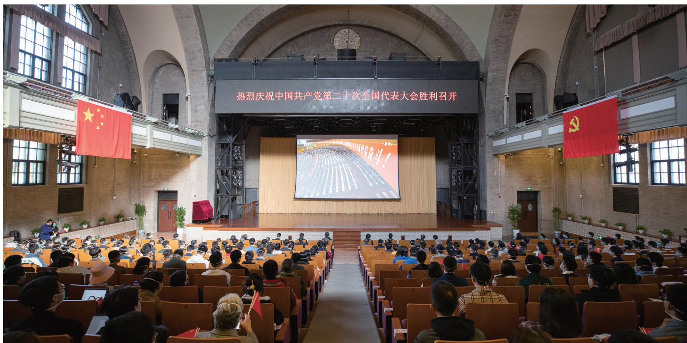
清华师生齐聚大礼堂收看党的二十大开幕会。