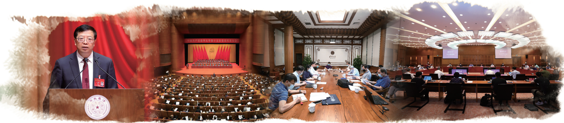
邱勇作报告。中国共产党清华大学第十五次党员代表大会开幕会场。