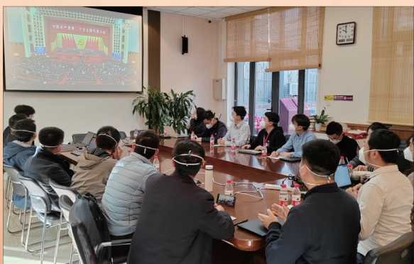
校团委党支部组织青年师生集中收看。